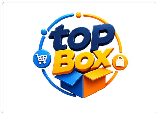
Versão Principal — Fundo Claro

O logotipo TopBox combina tipografia expressiva com elementos de e-commerce uma caixa aberta, ícones de carrinho, sacola e coração transmitindo modernidade, dinamismo e conexão com o universo do comércio digital.