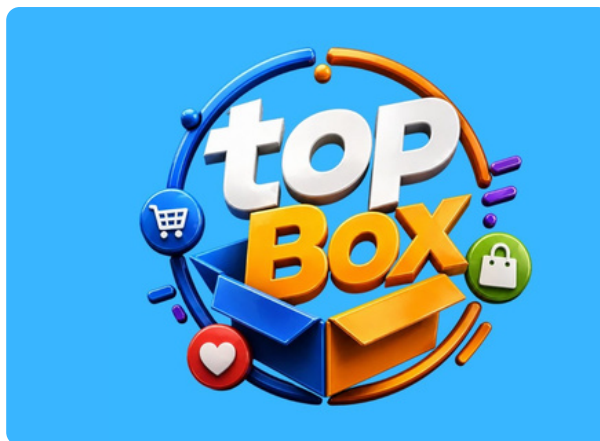
Versão — Fundo Escuro/Azul